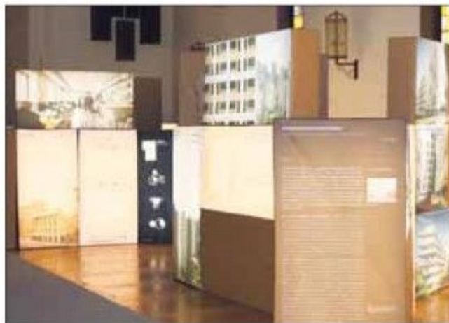
Die Ausstellung „Bezahlbares Wohnen“ in der Chapel des Mark Twain Village ist noch bis 25. Juni zu sehen.